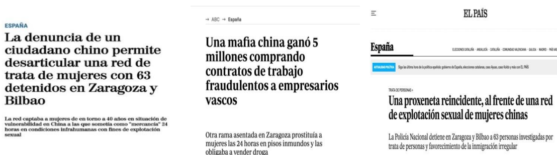
Figura 2. Noticias publicadas en El Mundo , ABC y El País sobre la operación policial Goliat-Boga, Fuente: Elaboración propia, 18/01/2022.

1 Concretamente y en referencia a la operación policial a la que alude la nota de prensa expuesta, se acompañó de una comparecencia pública en la que la prensa trató de averiguar más detalles del operativo. En dicha sesión, los responsables policiales añadieron que la denuncia que destapó la trama procedía de un ciudadano chino, del que no facilitaron más detalles al tratarse de un testigo protegido. También informaron de que la madame que encabezaba la red de explotación sexual era reincidente. Ambos detalles, fuera de la nota oficial, aparecen en los titulares de El Mundo y El País . Por su parte, ABC se centra en la rama de explotación laboral y sus abundantes beneficios, tal y como aparece en la Figura 2: