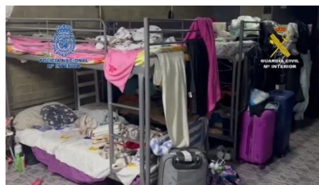
Figura 4. Imágenes de las noticias sobre trata de seres humanos, Fuente: El Mundo , 21/05/2019; El País , 26/04/2019; ABC , 30/07/2020; El Mundo , 08/12/2023.