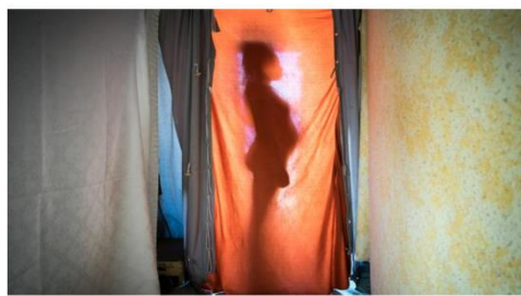
Una víctima de trata en el sitio donde estaba retenida