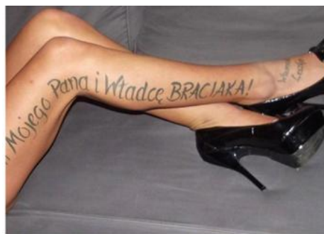
Imagen cedida por la policía en la que se lee en polaco "Entregado a mi casero y un hermano" con la firma de Laxeti en el empeño.