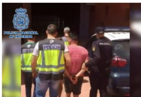
Los arrestados, custodiados por la Guardia Civil.

Están muy tasadas por el juzgado y, como la investigación continúa, no se hacen públicas. Antes nos pasaban imágenes de las habitaciones, las chicas en prostíbulos, etc. El acompañamiento policial con fotógrafo y redactor ya no se hace. (C. H., 05/03/2024)