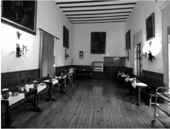
Refectorio del monasterio de Santa Teresa, ventana comunicación con las cocinas

pequeñas rendijas y celosías 23 . Las salas de labor, las de recreación, los tornos, locutorios, alacenas, miradores, terrazas, celdas de aislamiento, cárceles, etc. daban respuesta a una clausura estricta que se alejaba de la reflejada por los espacios de los frailes, impactando en la configuración de ciudad por su carácter hermético 24 .