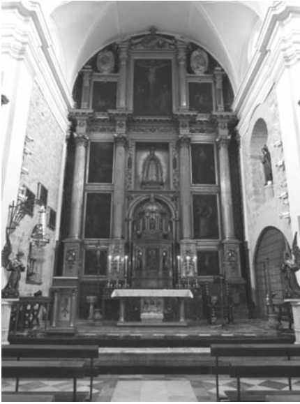
Capilla mayor y coro bajo de la iglesia del Monasterio de las Bernardas (Jaén).