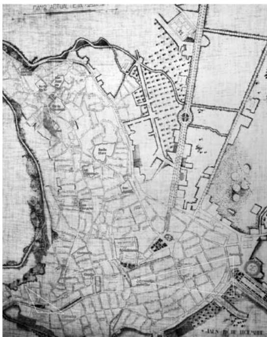
Triangulaciones en la ubicación de los conventos de Jaén en el siglo XVII y los dos grandes ejes sacros que conforman