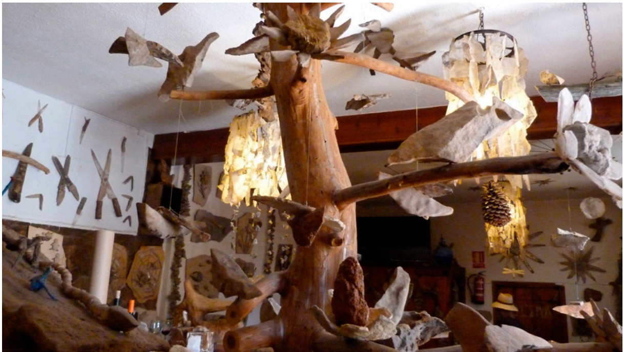
Mesón Las Pedrizas – Museo de Zoolitos.